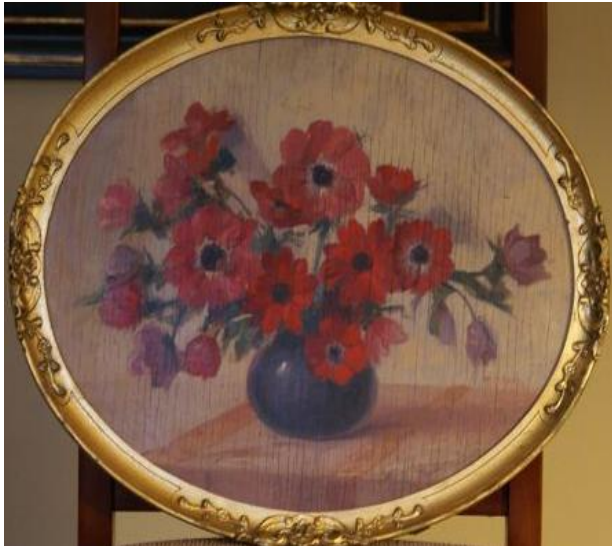
An oil on canvas on wood flower arrangement painting 1927