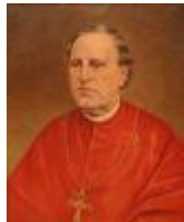
Portret van Kardinaal Dechamps (1810-1883), 1865, 63,5 x 53,5 cm Noordbrabants Museum