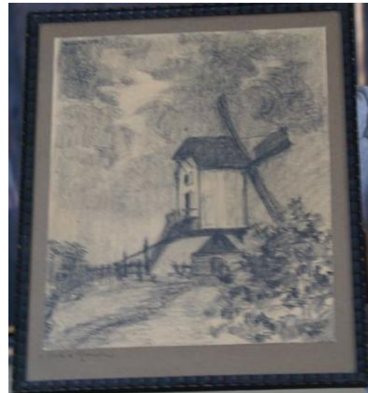
Pencil on paper, undated of Molen te Rosmalen